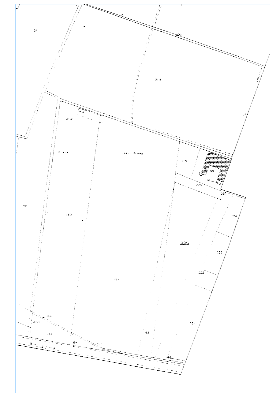
ESTRATTO DI MAPPA FG. N. 5 SCALA 1:2000