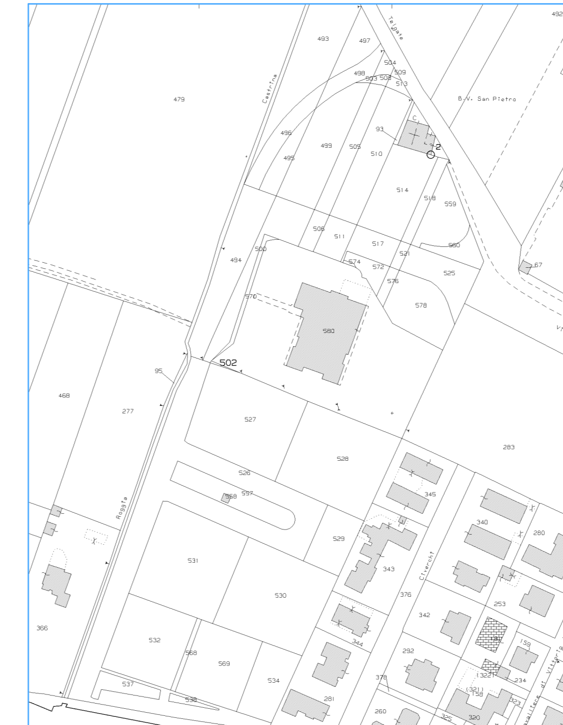
ESTRATTO DI MAPPA FG. N. 2 SCALA 1:2000