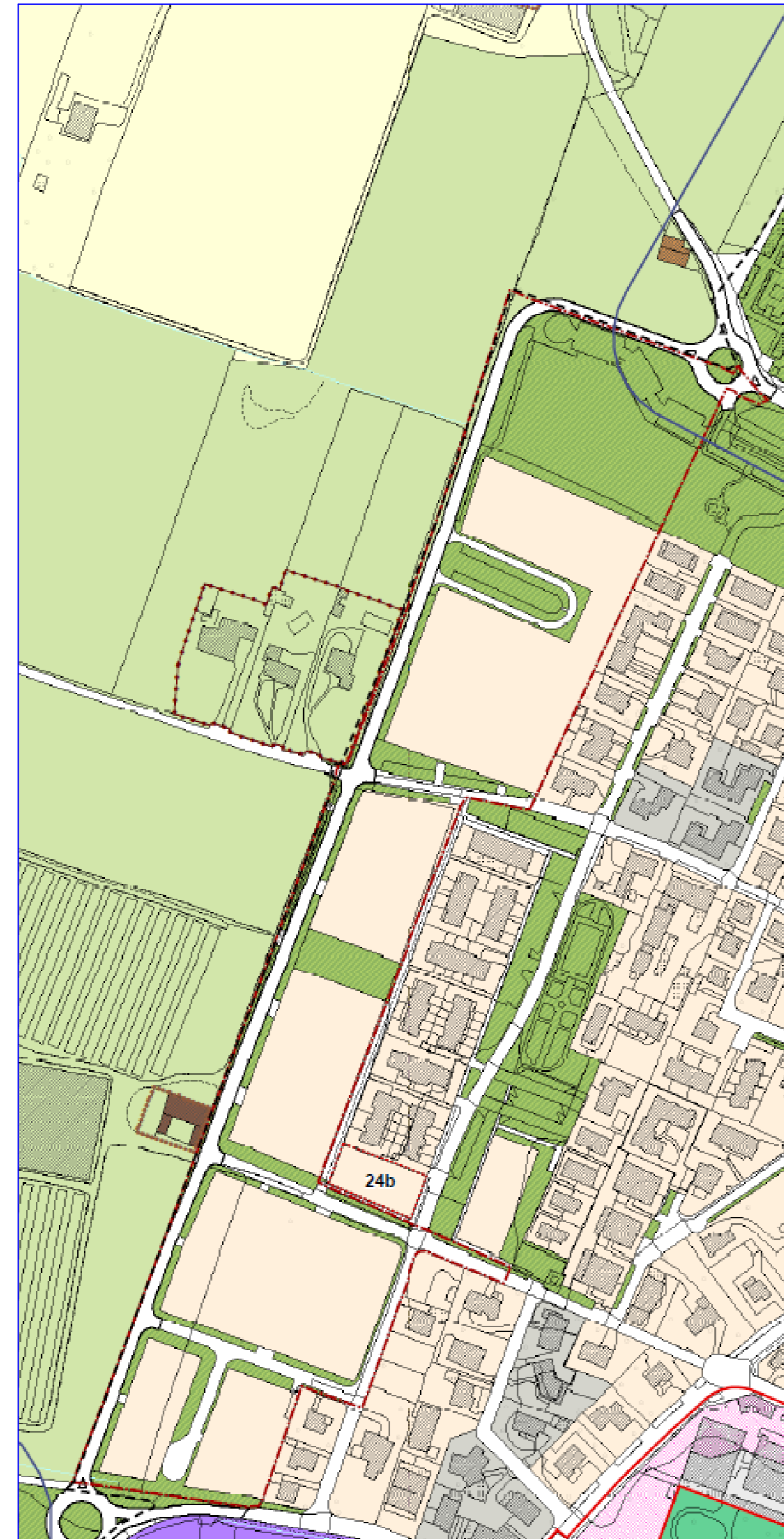
ESTRATTO DI PGT SCALA 1:2000