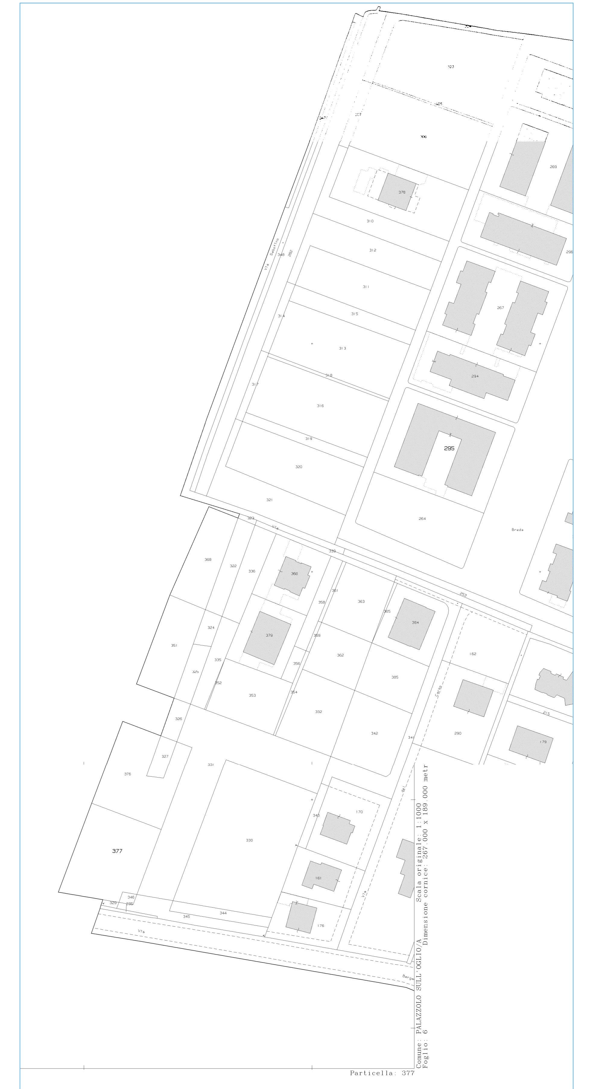
ESTRATTO DI MAPPA FG. N. 6 SCALA 1:1000

Comune - PALAZZOLO SULLO GIUGIA - Scala cartografica: 1:1000 Fig. 10 - 6 Dimensione cartacea: 287.000 x 189.000 metri Particella - 377